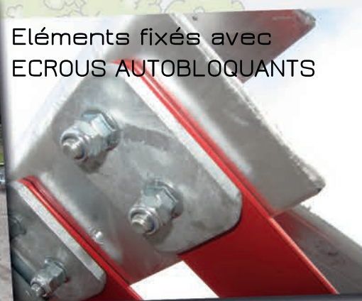
Éléments fixés avec ECROUS AUTOBLOQUANTS