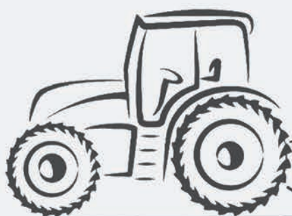
Bras de relevage baissé au maximum.